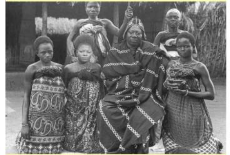
Béhanzin et quelques-unes de ses femmes

Marié à 12 femmes, il eut probablement plus de 50 enfants