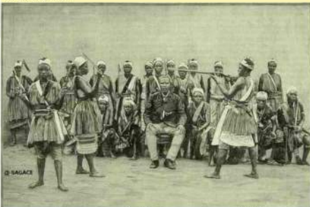
Amazones du Dahomey vers 1890

Les Mino sont recrutées parmi les ahosi ('les femmes du roi'), qui étaient souvent plusieurs centaines. D'autres sont enrôlées volontairement ou de force dans cette unité. Tant qu'elles sont Mino, les femmes ne sont pas autorisées à avoir d'enfants ou à être mariées. Le régiment a un statut semi-sacré qui est fortement lié à la croyance du peuple fon au vaudou.