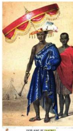
CEZE, KING OF DAHOMEY.

Le royaume d'Abomey, rebaptisé plus tard Dahomey, va étendre sa domination sur ses voisins pour devenir le plus important avant la colonisation, au XIXe.