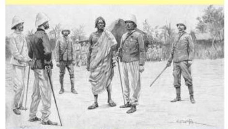
Gravure - reddition de Béhanzin

Sa célébrité vient de sa résistance à la colonisation. Il combattit les troupes françaises du général Dodds, de 1892 à 1894. Il signa sa reddition le 15 janvier 1894.