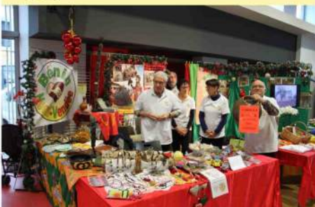
Le stand au marché de Noël salle des fêtes