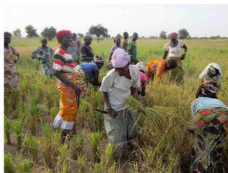
La récolte du riz