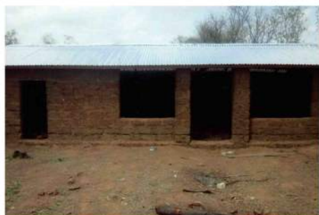
Le nouveau poulailler

Enfin, nous nous sommes acquittés de la somme de 620 € pour l'acheminement de 4 m 3 de matériel par le conteneur de novembre.