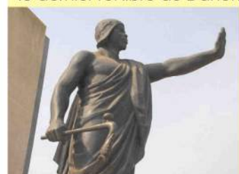
Monument de Béhanzin

Il fut déporté à la Martinique. Libéré en 1906, il mourut à Blida (Algérie) et sa dépouille ne fut ramenée à Djimé qu'en 1928. Une statue à l'entrée d'Abomey commémore ce personnage qui fut le dernier roi libre du Dahomey.