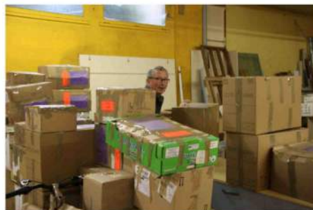
Préparation des colis

Merci à tous pour votre engagement dans cette opération.