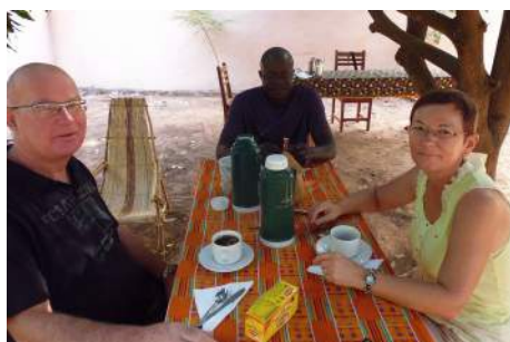
Petit déjeuner à l'hôtel du Baobab