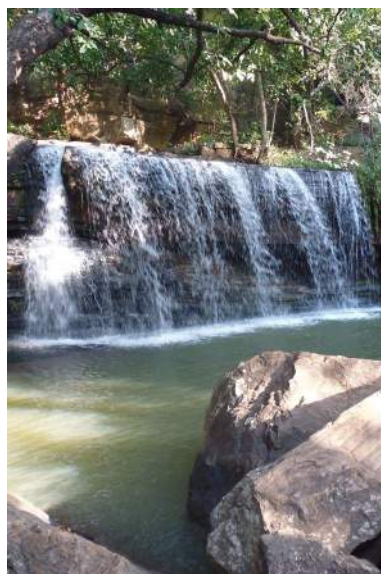
Les chutes de Tanongou

Le 21 : nous partons à 5 h 30 pour visiter le parc de la Pendjari qui nous laissera sur notre faim : beaucoup de kilomètres (150 km de piste en 4x4), peu d'animaux à voir (éléphants, antilopes, babouins....et un buffle) et un hôtel-restaurant plus que moyen. Nous visitons rapidement la cascade de Tanongou avant de retourner à l'hôtel du Baobab,