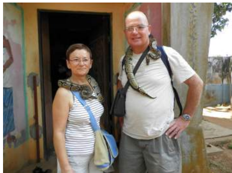
"Même pas peur !"

Le 15 : nous partons vers Ouidah visiter le Temple des Pythons, la basilique Notre-Dame , puis la Route des Esclaves avec les sculptures d'artistes, le mémorial Zoungbogji et la Porte du Non-Retour et direction Cotonou par la Route des Pêches.