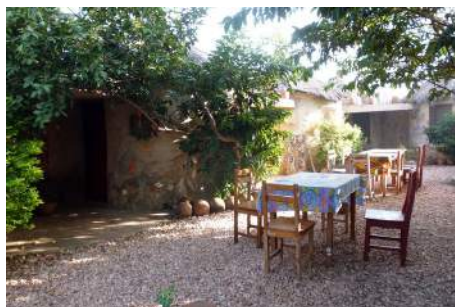
Un peu d'ombre pour se reposer...