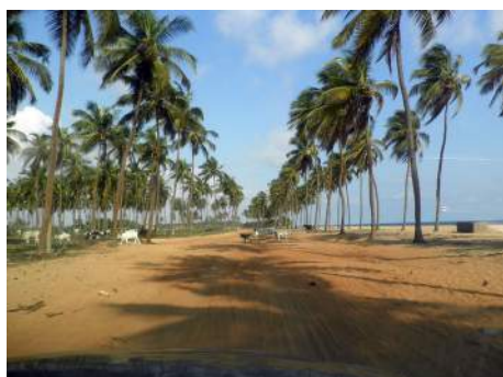
La route des pêches suit la côte atlantique

Le 16 : nous repartons vers Ganvié pour visiter en barque la cité lacustre. Puis nous prenons la route d'Abomey où nous visitons le Palais Royal.