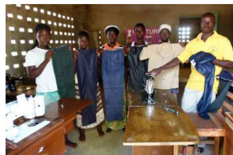
L'atelier de couture

Le forage pour l'eau ne fonctionne plus, la pompe étant hors d'état (un devis nous sera fourni le soir même), l'eau de la mission catholique vient actuellement du puits de l'UPA Misola !!!