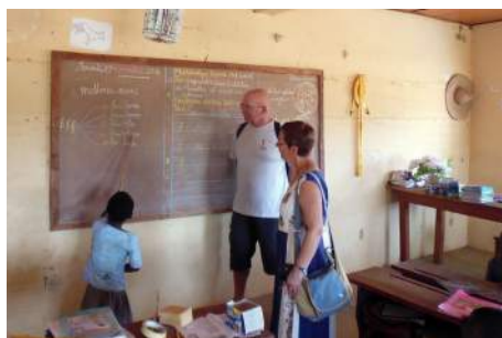
À l'école primaire