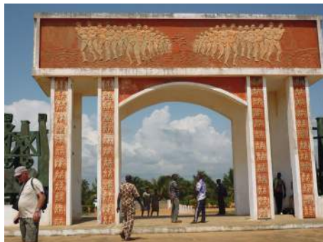
La porte du Non-Retour à Ouidah

Le 16 : nous repartons vers Ganvié pour visiter en barque la cité lacustre. Puis nous prenons la route d'Abomey où nous visitons le Palais Royal.