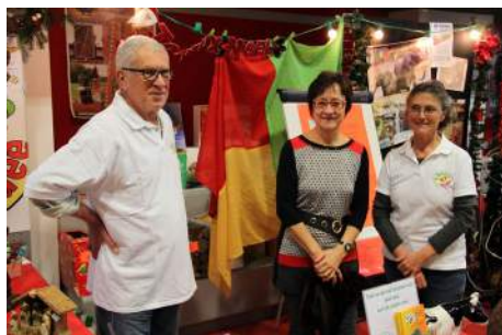
Le stand salle des fêtes