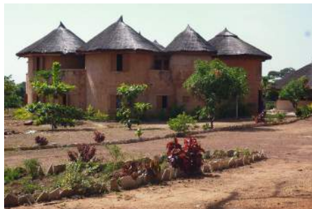
Un tata en pays somba

Le 22 : nous reprenons la piste vers le pays somba avec la visite intéressante du village de " tatas " *, puis retournons vers Natitingou avec dîner à l'hôtel-restaurant "La Brèche". Au menu, canard Tchouck (canard à la bière de mil).