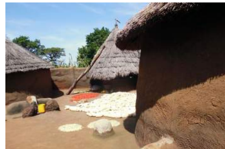
Sur la terrasse du tata

Le 23 : nous repartons vers Cotonou et passons une nuit à Dassa où nous apprécions le confort d'un bon hôtel.