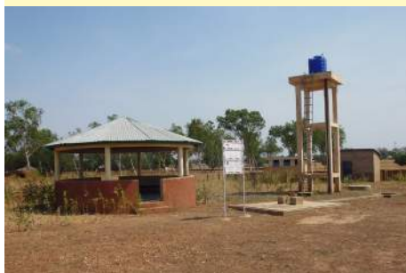
Le puits de l'atelier MISOLA

* Un groupement de femmes peut être défini comme un réseau d'entraide et de solidarité, ayant pour but un développement (souvent de nature économique) sous une forme coopérative.