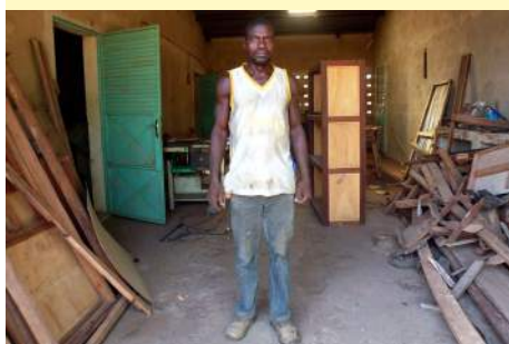
L'atelier de menuiserie