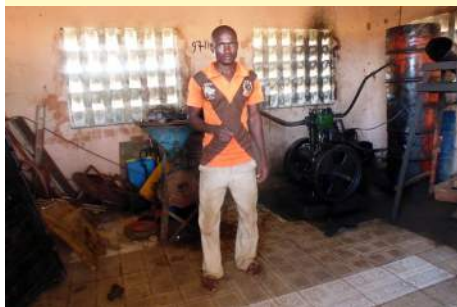
L'atelier de soudure