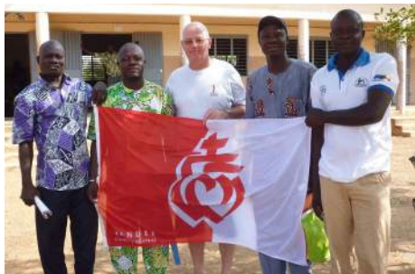
Remise du drapeau du CG de Vendée

Nous avons également constaté que le Père Hubert était très bien perçu par les habitants et pouvait disposer de moyens financiers importants (construction d'une classe au collège financée par des Belges !!!) et souhaitait vraiment s'engager aux côtés de BNV.