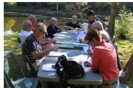
Réunion du C.A. à la Franchetière