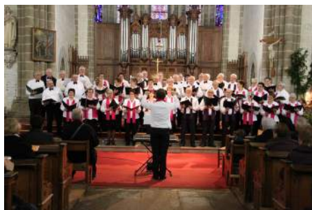
Les deux chorales

Un verre de l'amitié a réuni ensuite les choristes, les bénévoles et le public.