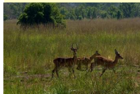
Groupes de cobes de Buffon

Son nom vient de la rivière, la Pendjari, affluent du fleuve Volta, prenant sa source dans le massif de l'Atacora.