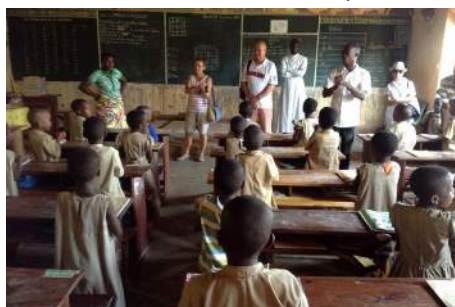
Visite de l'école de Kpomassé

Le 25 : nous allons visiter l' école de Kpomassé à 7 heures mais, problème de voiture, nous ne partons qu'à 10 h 15 pour 150 km et 4 heures de piste. Cette école doit être rénovée ! BNV a participé pour 300 € (ce serait bien de renouveler pour 2015). Nous rentrons par la Route des Pêches et arrêtons au Super U de Cotonou ! Nous dînons dans un restaurant local (dans le salon de l'habitation).