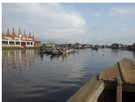
Ganvié se visite uniquement sur l'eau

Le 17 : partis vers Tanguieta à 6 heures, nous arrivons à Natitingou vers 14 h 30 après 450 km de route « trouée » (2 887 trous !).