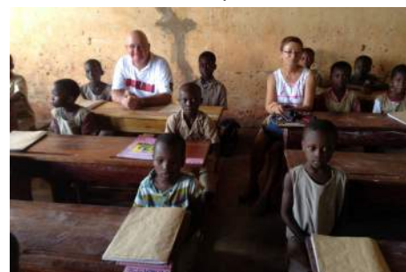
Retour sur les bancs de l'école...