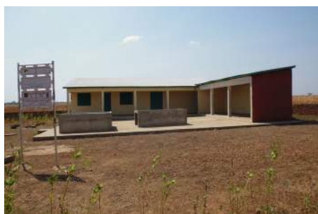
Unité de production de farine MISOLA