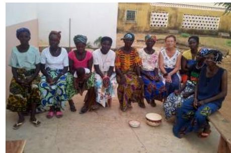
Le groupement de femmes

Nous visitons des champs de mil et de maïs dont le labour a été financé en partie par BNV à hauteur de 1 600 €. Mauvaise année de récolte du fait des pluies et particulièrement pour le maïs ! Aide à renouveler si possible pour 2015.