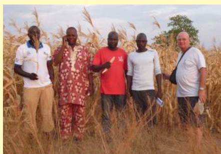
Visite des champs de maïs

Dans de nombreux pays d'Afrique occidentale et subsaharienne, cette pratique entraîne une "promotion sociale" de la femme face à la paupérisation croissante du milieu rural.