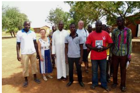
Principaux interlocuteurs à Gouandé

Afin que notre mission au Bénin perdure, il sera nécessaire d'établir un cahier (un classeur) où le matériel acheté devra être inscrit avec signature des deux parties. Ce document sera emmené à chaque mission de BNV pour un suivi qui doit être régulier. (méthode utilisée par l'ADMAB quand ils viennent visiter les mutuelles).