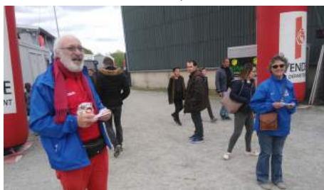
Nos vendeurs de billets de tombola