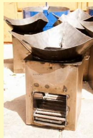
Cuiseurs à bois économiques (CBE)