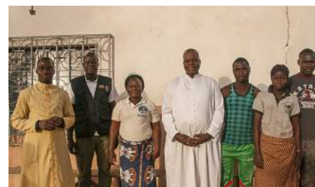
La "photo de famille" avant le départ