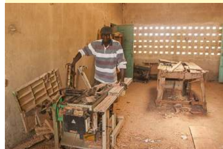
L'atelier de menuiserie est peu équipé