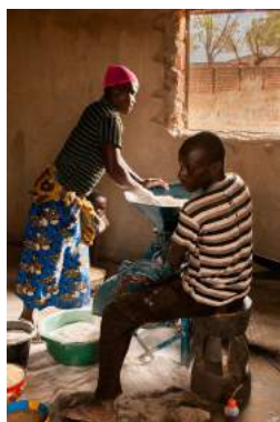
Le moulin (photo prise en 2015)

Le moulin tourne souvent à plein régime et les allers/venues des femmes apportant leurs grains pour repartir avec la farine sont incessants. Mais nous ne savons pas comment est géré son fonctionnement et qui en est responsable.