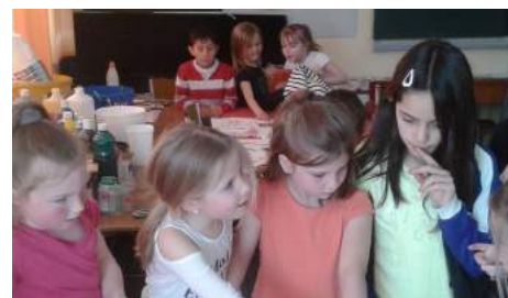
Écoute attentive des élèves de l'école Jules Verne.