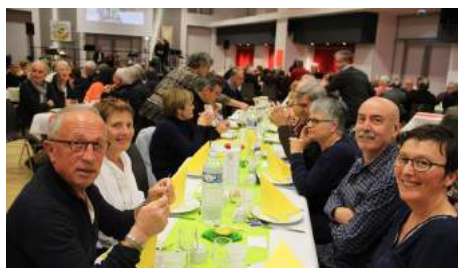
l'apéro arrive !!

https://www.facebook.com/ENSEMBLE-POUR-LE-BENIN-227942093941758/