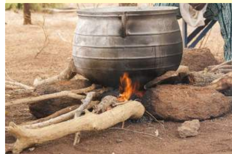
Foyer traditionnel pour la cuisson