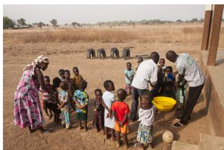
Le lavage des mains sans point d'eau n'est pas chose aisée

L'école n'a pas de latrines, ni de point d'eau et la cour n'est pas clôturée ce qui rend pour l'instant l'installation de jeux de cour impossible.