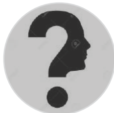
Postes à pourvoir Vice-président(e) Secrétaire adjoint(e)