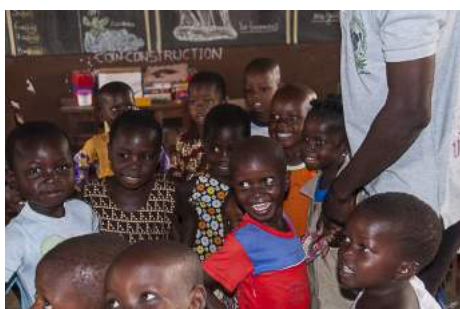
La joie sur le visage des enfants de maternelle

Le mardi 3 janvier, visite des 4 classes élémentaires de l'école catholique.