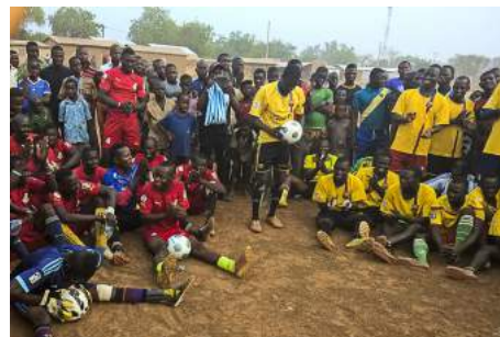
Avant le match de foot

L'électricité n'est toujours pas arrivée à Gouandé alors qu'elle l'est presque partout aux alentours. Le problème n'est pas simple à résoudre car il résulte a priori de positions politiques antérieures.