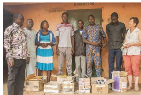
Les enseignants sont impatients d'ouvrir les colis rapportés de Cotonou