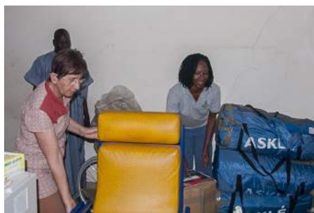
Livraison de matelas et de fauteuils à Matéri

Elle nous fait visiter le centre et constatons un évident manque de matériel. Nous l'assurons du soutien de BNV et du nôtre et repartons vers Gouandé.