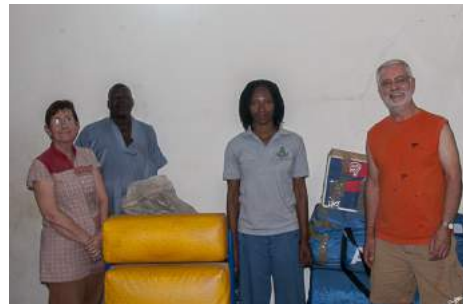
Déballage du matériel médical

Mission catholique, écoles, centre de soins, bureau du chef d'arrondissement, où qu'on aille, ils sont très attendus.