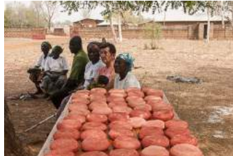
Les fromages à l'égouttage

Et puis c'est le nettoyage, avec un minimum d'eau mais avec d'autant plus d'efficacité, jusqu'à la dernière goutte ! Tout cela se faisant dans une ambiance qui ne laissait aucun doute sur le plaisir qu'avaient ces femmes à travailler ensemble. Chacune est repartie avec ses fromages de soja, fruits d'une journée de travail parfaitement réussie, et un ananas (denrée rare à Gouandé) que nous avons apporté des environs de Cotonou.