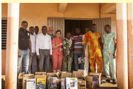
Les colis avant le grand déballage

Les livres d'espagnol (seconde), de géographie (seconde), d'anglais (seconde), d'histoire/géo (1ère et terminale) d'orthographe, et la revue "Lire" sont très appréciés.