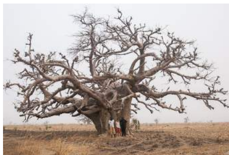
Ce baobab est bien esseulé

Plutôt que des grandes opérations telles que "la journée de l'arbre" où le gouvernement entraîne les habitants à planter massivement, mais sans suivi (ce qui est mortel aux arbres qu'il faut absolument arroser en saison sèche), le projet viserait à responsabiliser les gens à planter et entretenir moins d'arbres, mais près de chez eux et dont ils auraient la charge.