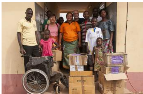
Les colis pour le centre de santé de Gouandé