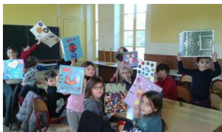
Les classeurs confectionnés par les élèves de l'école Des Jardins.