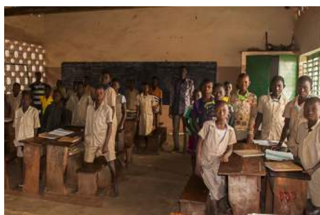
Quelques enfants d'une classe élémentaire