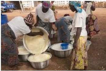
Pendant la préparation du soja

Mercredi 1er février, les femmes prennent possession de la cour et la nettoient. Déjà les foyers sont allumés et elles commencent à cuisiner.