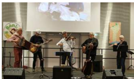
L'orchestre "Les APIBOTS"